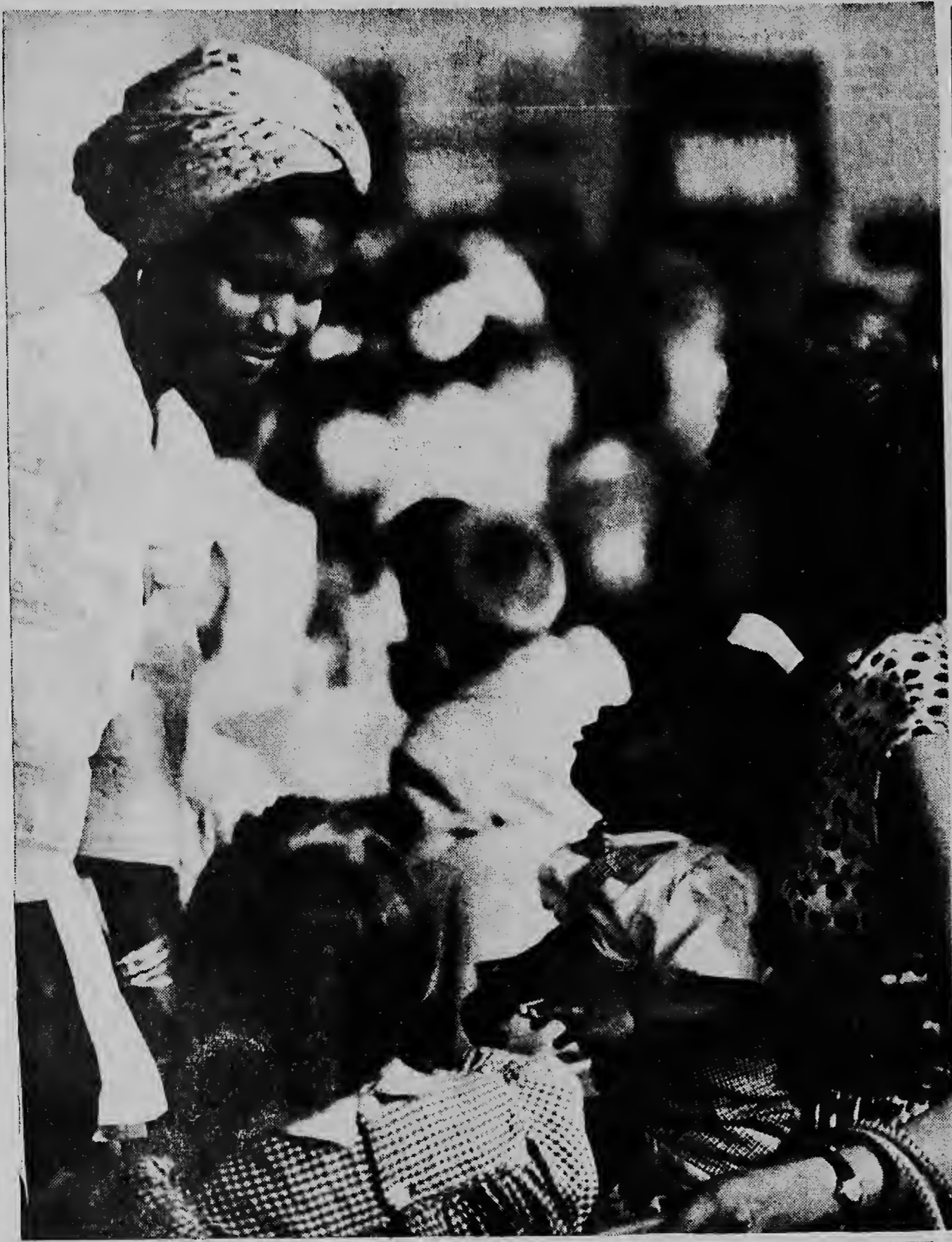
Lake 20 anja pasa no tabata parece posible, awor ta sucede cu di mas grandi facilidad. Foi despues di Gera Mundial II a ser proba cu no ta imposible cu hende di color por bira bicinja di hende blanen i door di e practicanan cu a ser haci esaki tabata asina exitoso i e bida di prohimo un cu otro ta sigui den di mas grandi armonia, manera nos mes por comprende mas o menos mirando e portret aki.